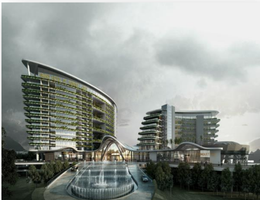
3、碧桂园森林城市酒店